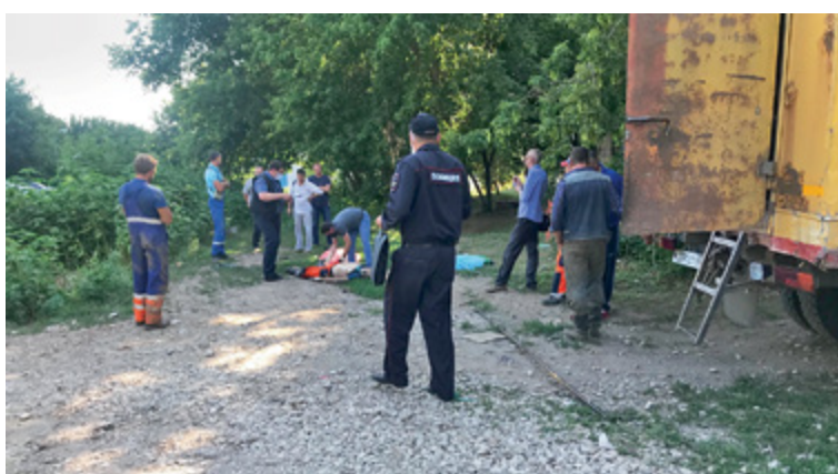
ФОТО С МЕСТА ТРАГЕДИИ

Второе – ввести личную ответственность начальников цехов за организацию работы по охране труда. Руководитель обязан знать, кто и как проводит инструктажи; проверять и самих инструкторов, и то, как все сказанное восприняли рабочие. Начальник сам должен выборочно присутствовать на инструктажах несколько раз в месяц.